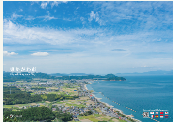
ポスター ※ 最大A1サイズ