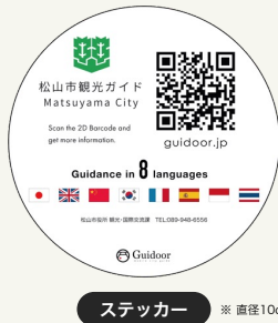
ステッカー ※ 直径10cm

また、ポスターの作成に加え二次元コードのデータも提供できますので、 貴自治体や観光協会などで作成されるパンフレット・チラシなどにも是非活用 ください。