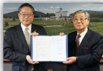
全国の信用金庫ネットワーク「よい仕事おこしネットワーク」との協定締結

弊財団の知見や技術を生かした取組みを幅広く発信することで、スーパーシティ構想の実現に取り組む全国の自治体などに「観光」分野において貢献してまいります。